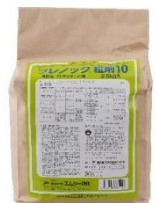
フレノック粒剤2.5kg 5,280円(税込)