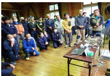
【たこ足配線の発熱実験】