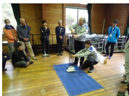
【ヘルメット衝撃危険体験】