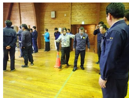
【飲酒状態疑似体験】