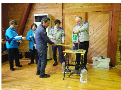
【回転機器巻き込まれ危険体験】