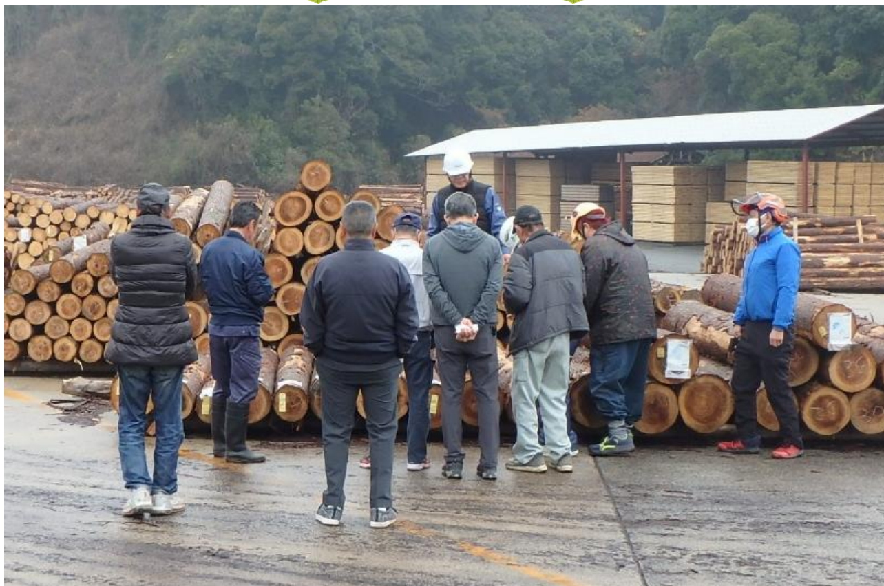
令和8年1月16日(金)開催 共販市の様子