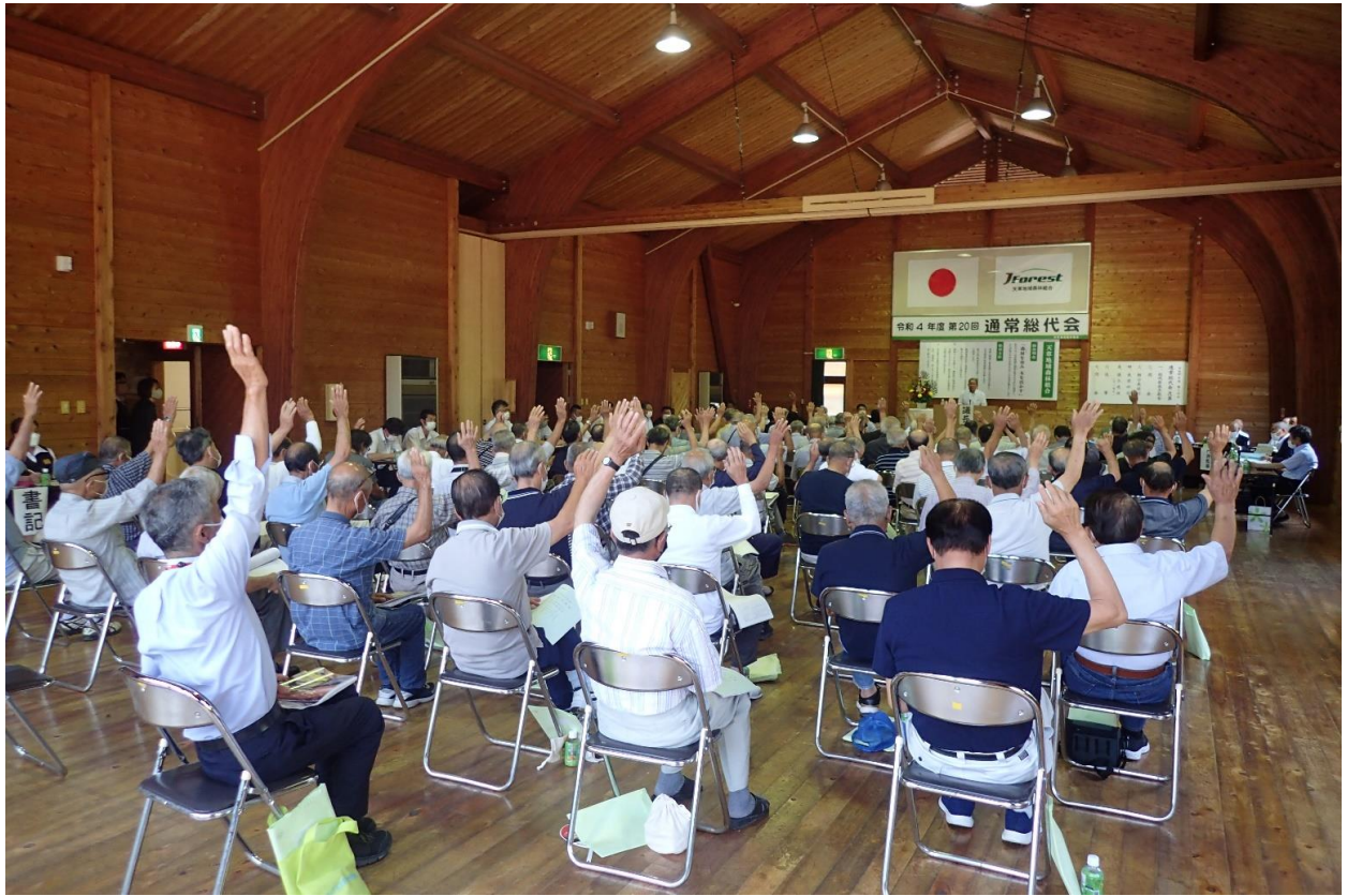
令和4年度（第20回）通常総代会の様子