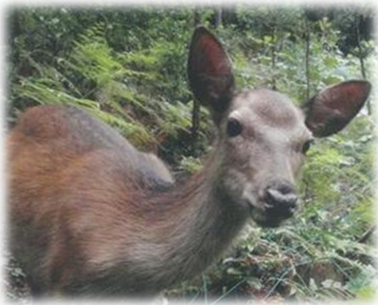
(県内で目撃されたシカ)

シカの増加を食い止める対策を検討するために、シカを目撃された際は、天草広域本部農林水産部 林務課(0969-22-4359)までご報告ください。