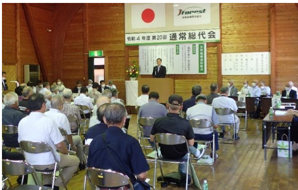
馬場昭治天草市長挨拶