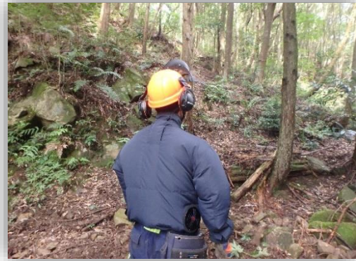
森林を育み木を活かす(4)